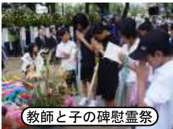
教師と子の碑慰霊祭

その後全員体育館に集まり、児童委員が「教師と子の碑」慰霊祭への参加報告をし、校長先生の話の聞きました。暑い中、夏休み中の登校日とは思えないほどの集中力で真剣に話を聞く子どもたちの態度に、平和への強い願いを感じました。最後に、「アオギリの歌」を全校児童で合唱し、平和のつどいを終わりました。