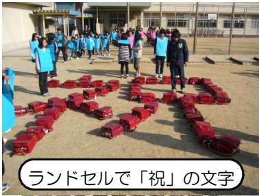
ランドセルで「祝」の文字