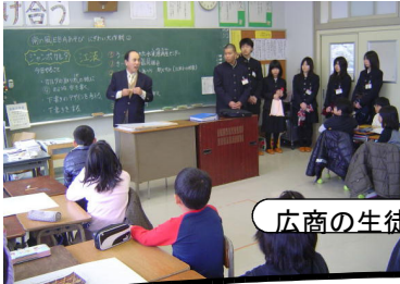
広商の生徒と共同作業