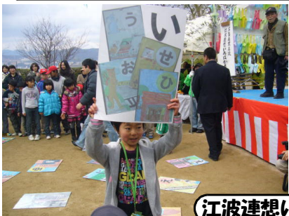
江波連想いろはかるた