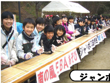
ジャンボ江波巻き

江波小学校PTAも、うどん販売などで地域の一大イベントに貢献されました。お疲れ様でした。とんど・江波の盆踊りで締めくくられた南の風EBAあそび。江波小学校も、この地域総出の手作りの祭りに参加することができました。企画・運営された「南の風実行委員会」の皆様をはじめ、ご協力いただいた地域・保護者の方々に感謝申し上げます。来年の南の風EBAあそびも、盛り上がることを期待しています。