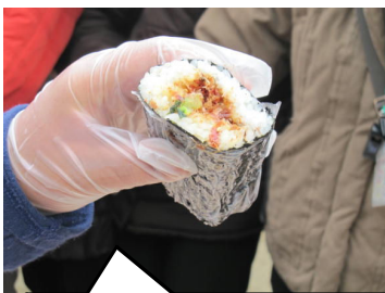
おいしい江波巻きのできあがり！