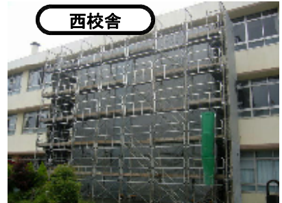
防音シートが貼られた教室

迎える江波小学校ですが、この防音シートなどのため、 例年よりも子どもたちの学習する教室の風通しが悪くなり、室温が上がる可能性があります。 ただし、この耐震工事終了後は、空調工事が始まり、平成24年度には 全教室にエアコンが設置 されます。そこで、本年度に限り、子どもたちの学習環境をより良いものにするため、保護者の皆様のご協力をお願いいたします。 ご家庭に、不用の扇風機がございましたら、今シーズン学